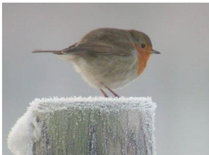
roodborst in de winter

Zou het nog gaan winteren, of is het voorjaar al begonnen?