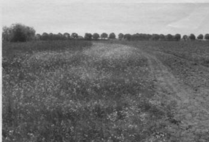
Akkerranden passen prima in de vergroeningseis van het nieuwe GLB.

voor de pilot. De graslandranden van veehouders minder, permanent grasland is sowieso een vorm van vergroening. Wel wordt er gekeken mogelijkheden voor een vervolg van deze randen binnen het stimuleringskader Groen Blauwe diensten (Stika) van de provincie Noord-Brabant.” Alle ARB-deelnemers ontvangen binnenkort meer informatie.