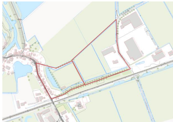
Routekaart met de nieuwe wandelverbinding