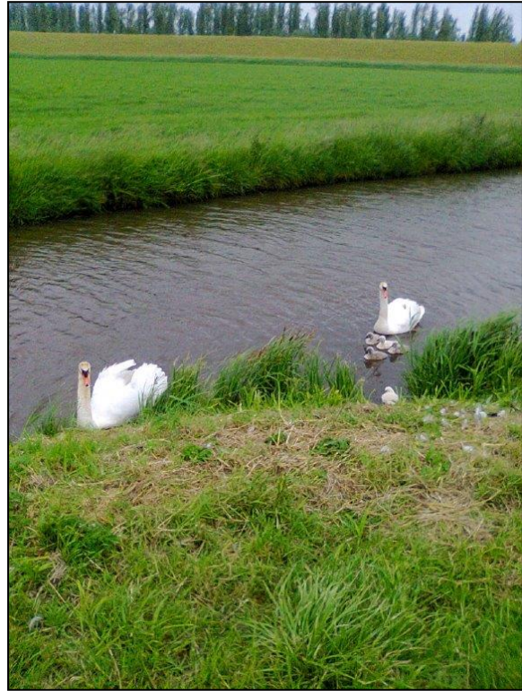
Jan Verhoeven nam deze foto's, van jonge zwaantjes, in natuurgebied Polder Schuddebeurs.