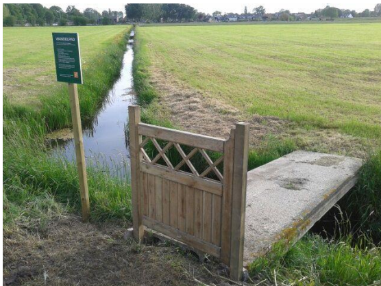
Bruggetje aan de Moerseweg/Wilgenweg

Wil je de wandeling een keer gaan lopen kijk dan op de site van onze ANV voor meer info. Dit ommetje loopt vanaf de Stationsweg, langs de voetbalvelden, richting Wilgenweg/Moerseweg.